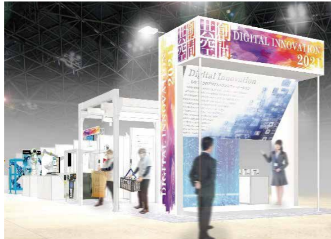
共催: 経済産業省北海道経済産業局、(株)北海道銀行、(株)北洋銀行 (公財)北海道科学技術総合振興センター(ノーステック財団)

食関連産業をはじめとする労働集約型産業において、今後も競争力を維持していくためには、ロボット・AI・IoTなどのデジタル技術を持つ潜在能力を最大限に活用して属人的な業務からの脱却を図るなど、従来の「ものづくり体制」に新たな風を吹き込む必要があります。共創空間! Digital innovation 2021では食関連産業を中心とした製造業のDXを強力に後押しするために、ロボットメーカーや道内のシステムインテグレーター(Sier)による実機展示やデモンストレーションを行い、製造現場のDXを強力に後押しします。