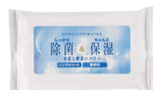
ハンディウェット 【12枚入】