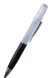
ボールペン型スプレー